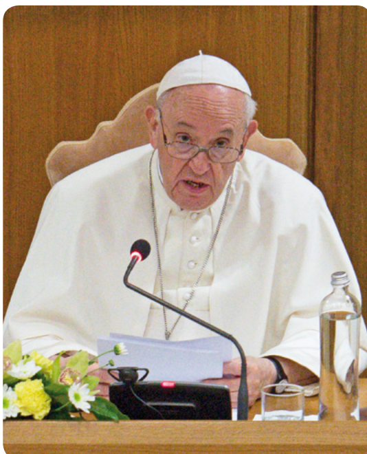
El papa Francisco abre el Sínodo de los Obispos en Roma

De esta manera se verá cómo una Iglesia más sinodal es una Iglesia de la escucha, en la que cada uno tiene algo que aprender: los Laicos/Laicas, los Pastores y el Obispo de Roma; el uno en escucha de los otros y todos en escucha del Espíritu Santo para conocer lo «que dice a las Iglesias», como recuerda el libro del Apocalipsis 2,7ss.